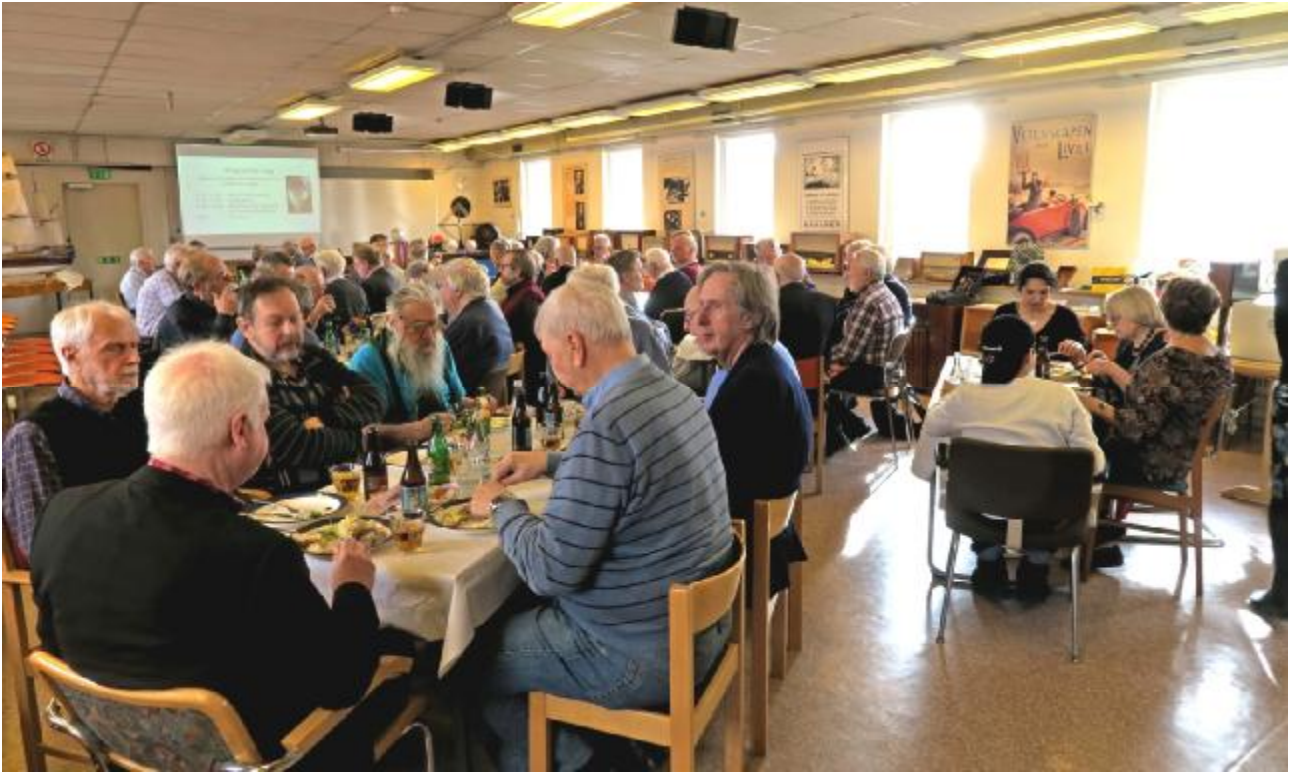
Efter årsmötet möblerade vi snabbt om till fest, något som alla uppskattade mycket.