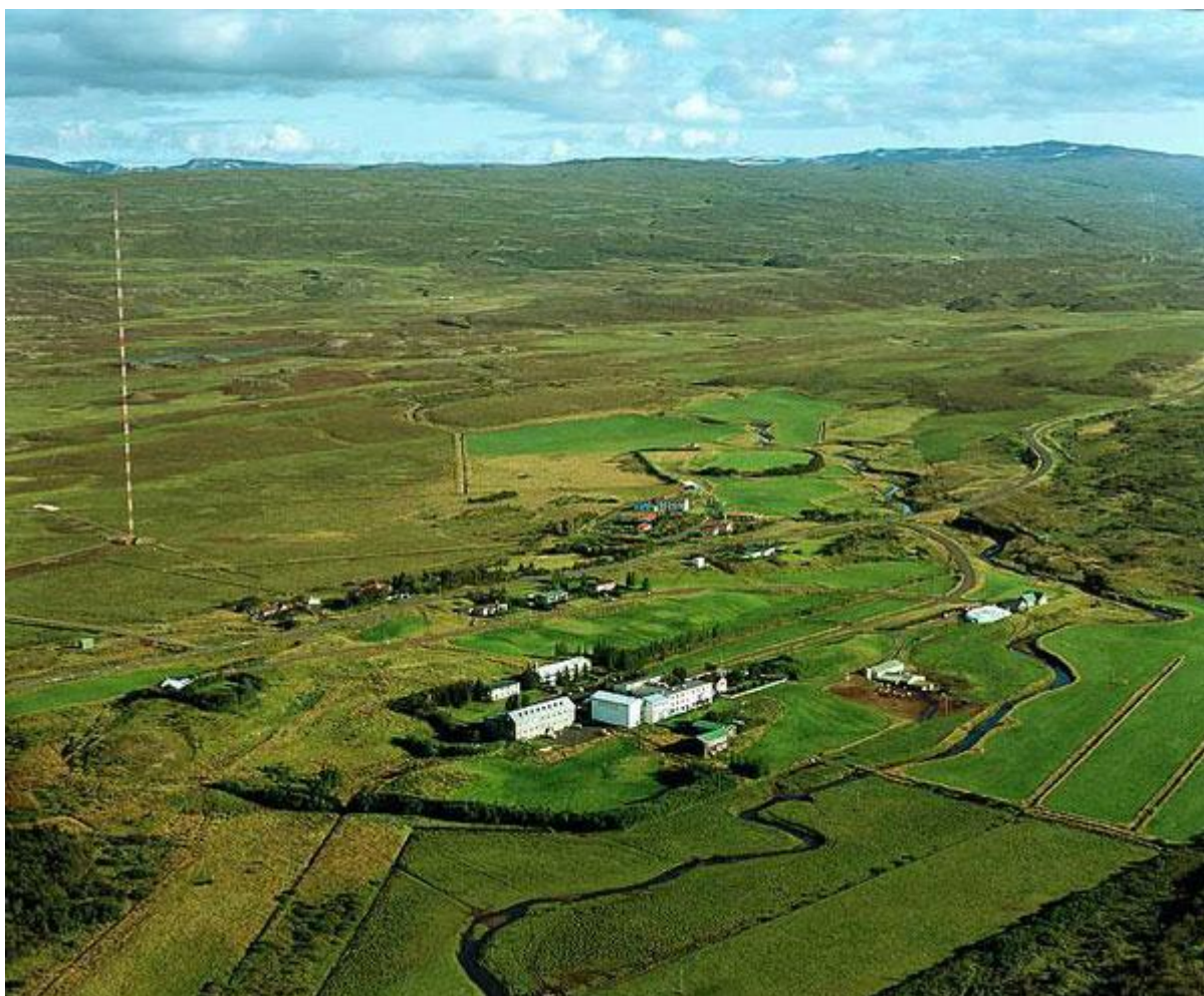
Isländska långvågssändaren i Eiðar på 207 kHz, 100 kW, masthöjd 220m.

Dagens trevliga upptäckt var att för första gången få höra Islands Rundradio (RUV) på långvåg. Det gick därför att man börjat utnyttja frekvensen 207 kHz som tidigare varit upptagen av den nu nedsläckta sändarna i Kiev samt Deutschlandradio Aholming. RUV:s sändare ligger i Eiðar och är på 100 kW. I min ungdom fick Reykjavik dela på frekvensen 182 kHz med Ankara och Luleå och var därför helt ohörbar för mig som då bodde i Umeå.