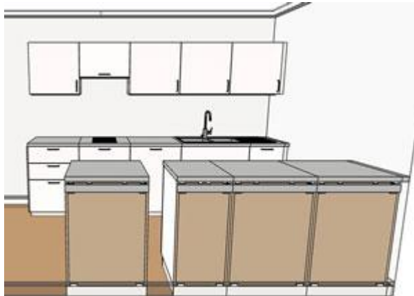
Variant 1: Framifrån

Vi har en köksgrupp som har arbetat en tid med att ta fram ett förslag till modernisering av köket. Nedan presenterar Bengt Lindberg förslaget till köksdelen av projektet. Köksgruppens förslag behandlas av styrelsen den 2 april. Synpunkter på förslaget kan lämnas till styrelsen via info@radiomuseet.se