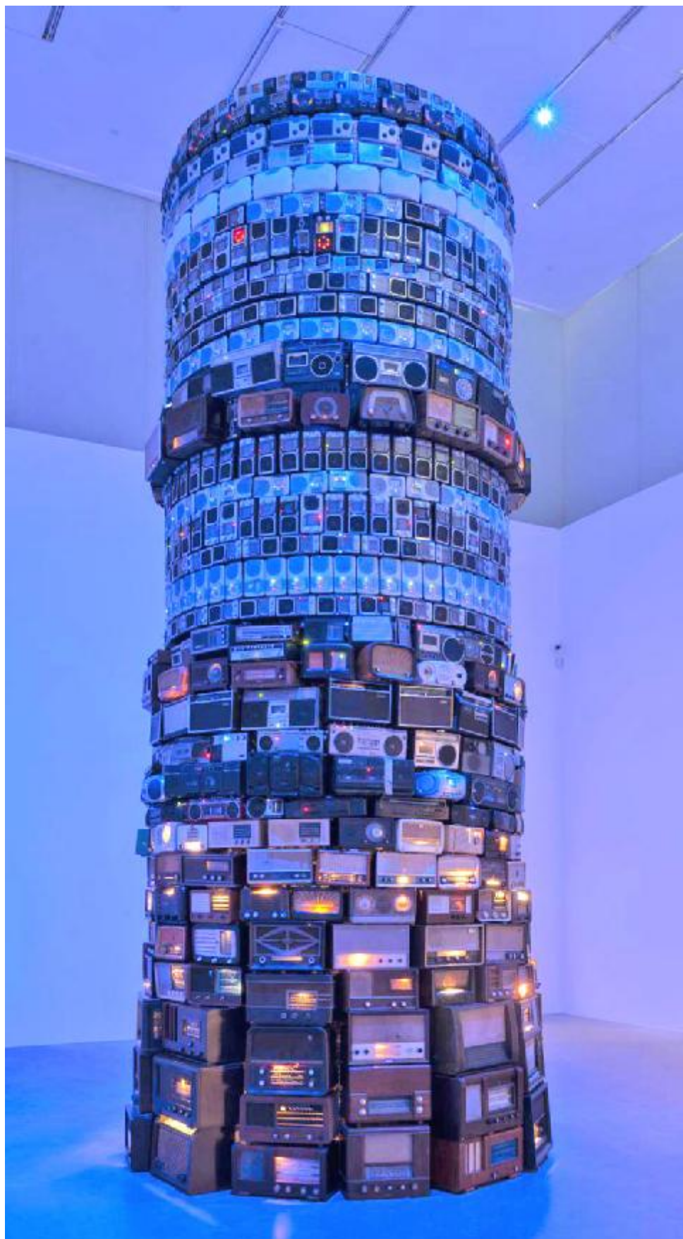
Babel skapat 2001 av Cildo Meireles. (Tate Modern, London)